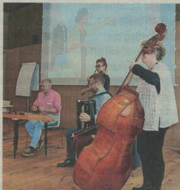
Klangvoller Auftakt vor der Versammlung.

Eine Rekordzahl von Mitgliedern des Vereins Kultur am Säntis konnten am vergangenen Samstag im neu gebauten Säntis – das Hotel ihre Hauptversammlung abhalten. Die statutarischen Geschäfte waren dabei fast schon nur Nebensache.